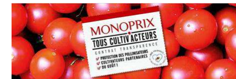
Février 2017 - Newsletter #1